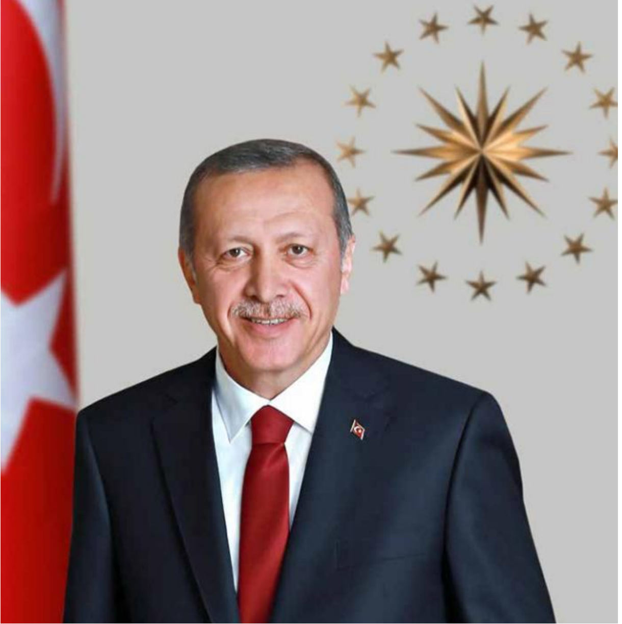
Recep Tayyip ERDOĞAN Cumhurbaşkanı